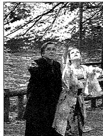
Ciné-Club de Chicoutimi

Le Ciné-Club de Chicoutimi présente le film Cherry Blossoms le lundi 5 octobre à l'école Polyvalente Lafontaine de Chicoutimi. Deux représentations seront présentées, une à 17h et l'autre à 19h30. Le lundi suivant, on y verra C'est dur d'être aimé par des cons . Pour plus d'informations, contactez le 418 549-3910.