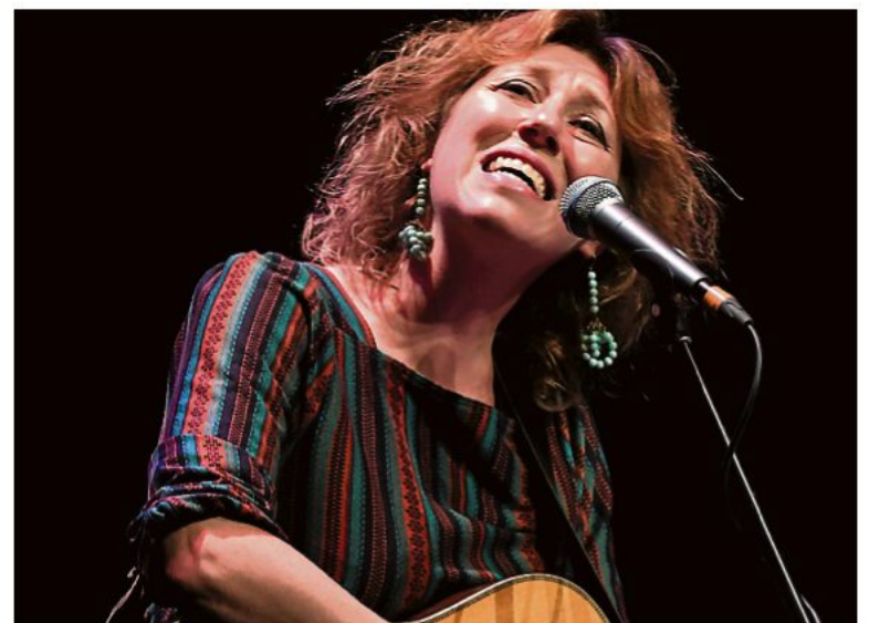
Martha Wainwright chantera à Chicoutimi en avril.