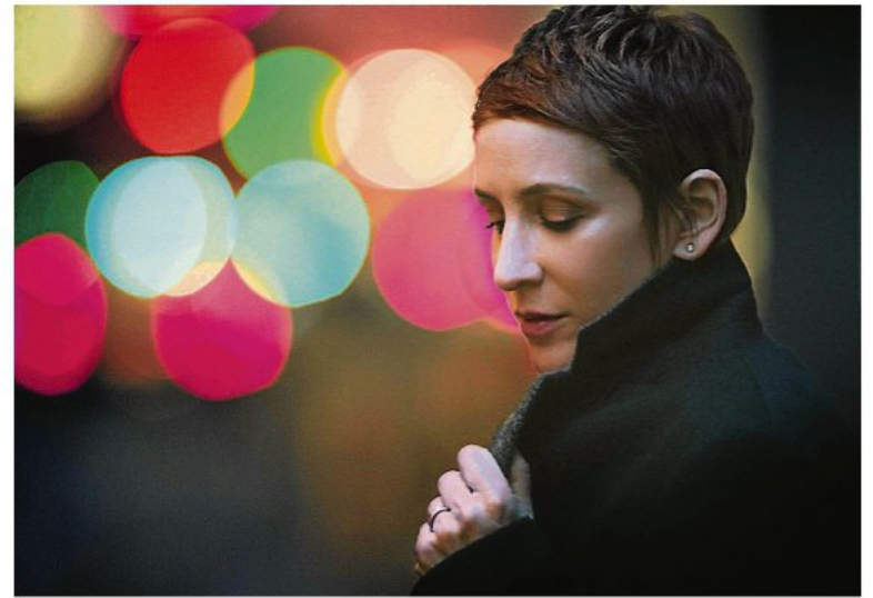
Stacey Kent et ses musiciens proposeront un spectacle où la bossa nova occupera une place de choix.